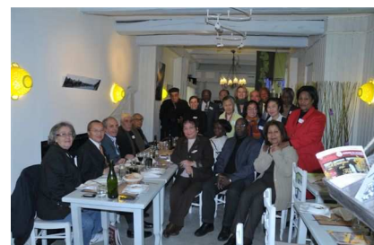
Remise des livres aux Patriarches au Respec'Table

Vous pouvez recevoir le livre sur simple demande à l'équipe de BATIK International par mail ou par téléphone au 01 40 10 97 79. Il est gratuit !