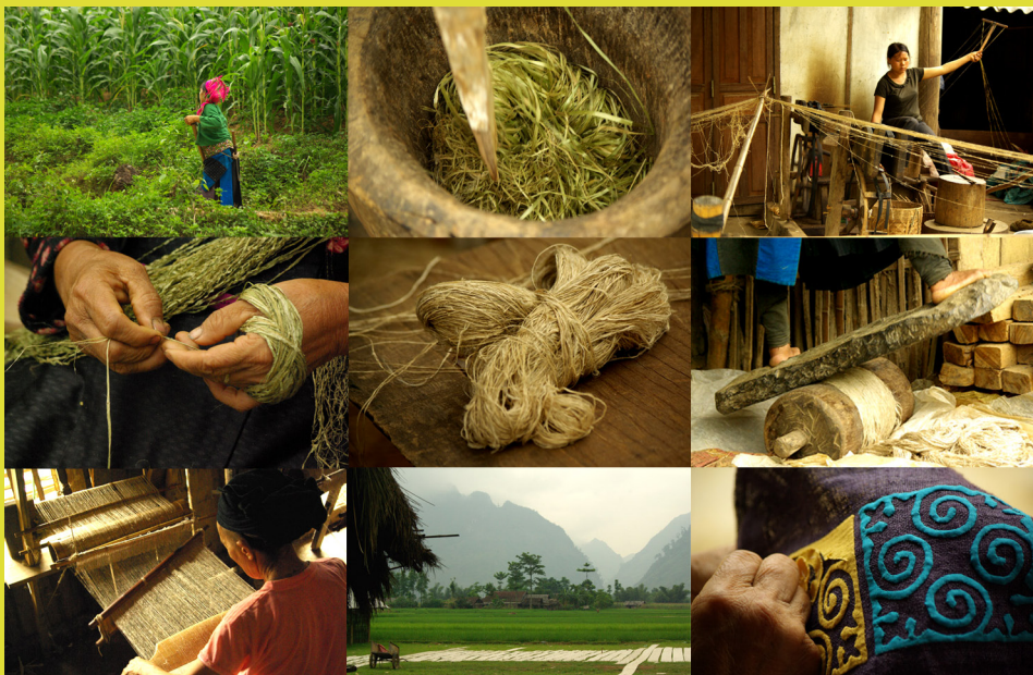
Etapes de transformation du chanvre

Le chanvre est par la suite teint à l'aide de colorants naturels, avant d'être orné de broderies et d'appliqués chargés de significations.